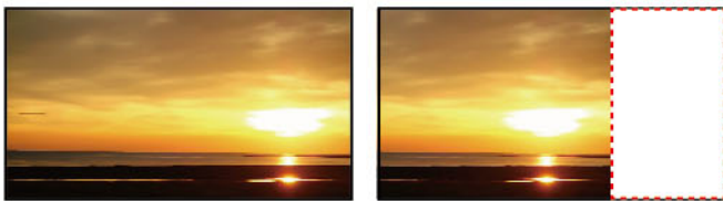
↑寬銀幕多3分之1的畫面

多半的環境中屋內的挑高都是不足的，寬畫面投影相同高度，給您多三分之一的畫面，您將體驗不同的教學情境。