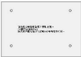
←快速四點定位記憶功能

採用與鏡頭同軸設計的互動定位設計，出廠內定投影80~90吋免定位功能。如需重新定位也只要快速四點定位，定位訊息儲存在互動投影機內，日後移動投影機或調整畫面大小，都不需重新定位，內建光學感應模組，提供投影畫面直接書寫及操控電腦功能，隨機附二支書寫筆是行動教學的最佳解決方案。