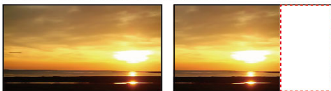
↑寬銀幕多3分之1的畫面

多半的環境中屋內的挑高都是不足的，寬畫面投影相同高度，給您多三分之一的畫面，您將體驗不同的教學情境。