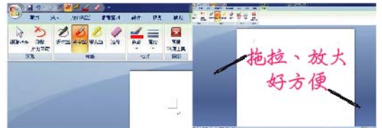
↑系統啟動手寫功能

捷達互動投影機支援了Windows10的筆觸功能，連接上電腦之後，作業系統便會自動將投影機辨認為是觸控螢幕，之後便會觸發各種觸控螢幕獨有的功能，如在微軟的office系列軟體中會自動啟動手寫功能，也能直接利用光筆在投影畫面中手寫輸入，辨識率非常的快速而且正確。