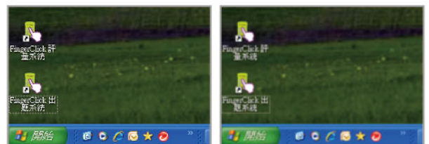
↑捷達投影機四角依然清晰

獨有數位影像處理技術，讓畫面四角依然清晰銳利、色階自然細膩，有別於市面投影機投影畫面四角不清晰的狀況。